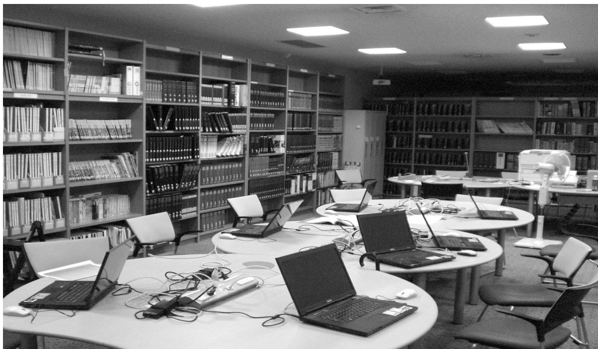
日本外務省研修所圖書室