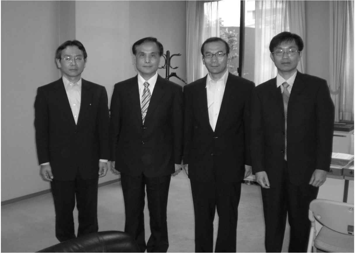
參訪人員與日本外務省研修所副所長西岡淳（右二）等人合影