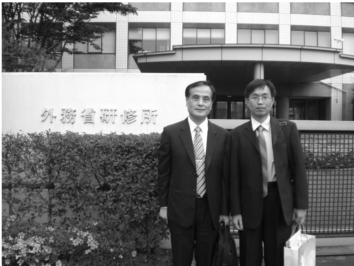
參訪人員於外務省研修所門口合影