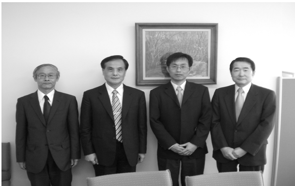
參訪人員與財團法人日本人事測驗設計中心研究開發本部部長(右一)等人合影