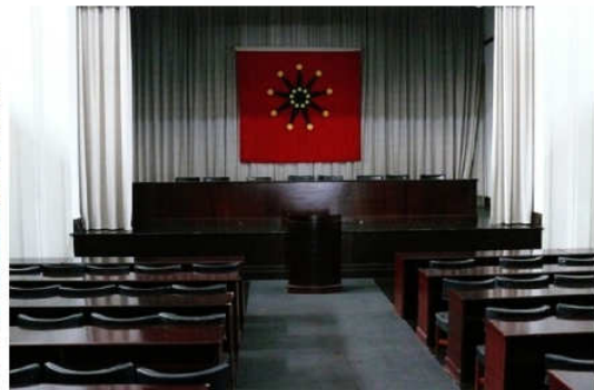
參訪辛亥革命紀念館