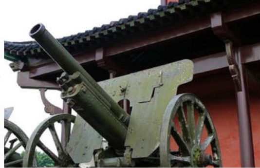
參訪黃鶴樓、起義門