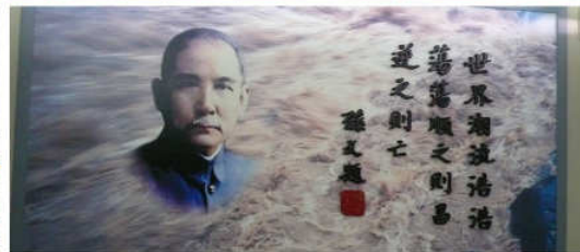
兩岸文化藝術交流展－孫中山與台灣開幕典禮