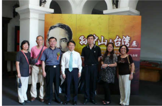
兩岸文化藝術交流展－孫中山與台灣開幕典禮