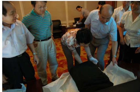
專訪宋慶齡基金會