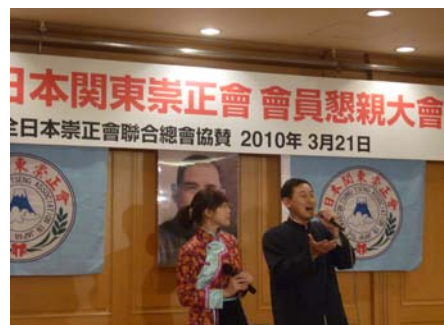
愛客家說唱表演團（圖左）與台灣客家山歌團（圖右）精采的演出內容，博得與會者熱烈掌聲