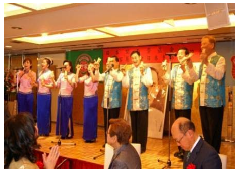
愛客家說唱表演團（圖左）與台灣客家山歌團（圖右）帶來精采的說唱藝術及山歌演出內容