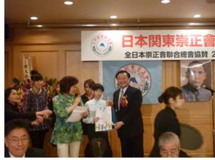
與會人士觀賞客家藝文表演節目，並參與摸彩活動