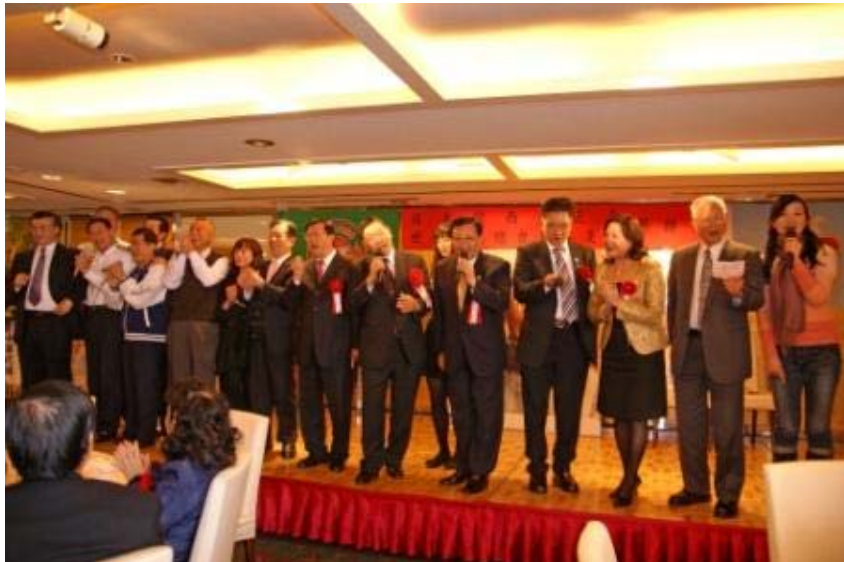
大會在全體貴賓及鄉親齊唱「客家本色」聲中圓滿結束