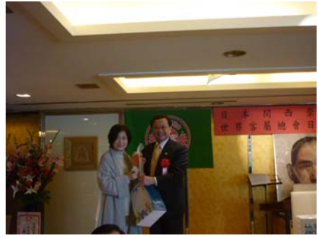
與會人士於懇親交流餐會中欣賞各項表演節目及參與摸彩活動