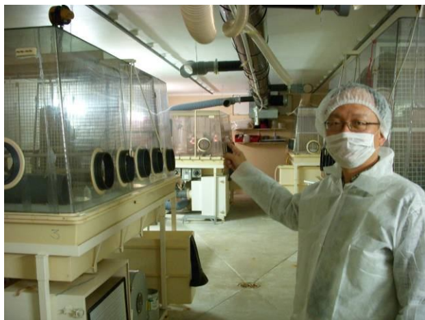
INRA-感染研究試驗 A2 至 A3 等級感染試驗操作台