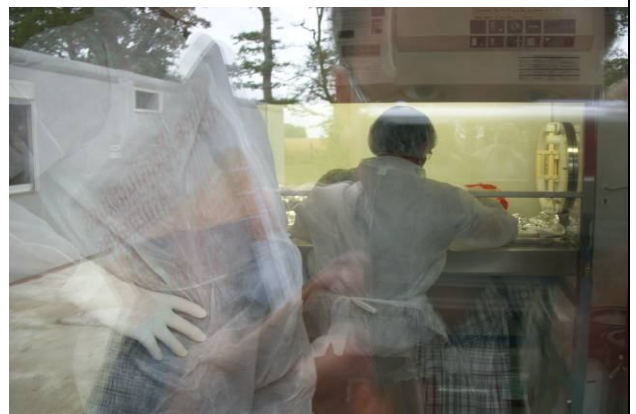
INRA-感染研究試驗研究人員操作情形