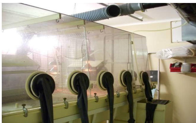
雞飼養於 INRA-感染研究試驗 A2 至 A3 等級感染試驗操作台情形