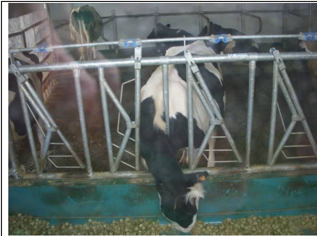
INRA-感染研究試験大型動物試験場