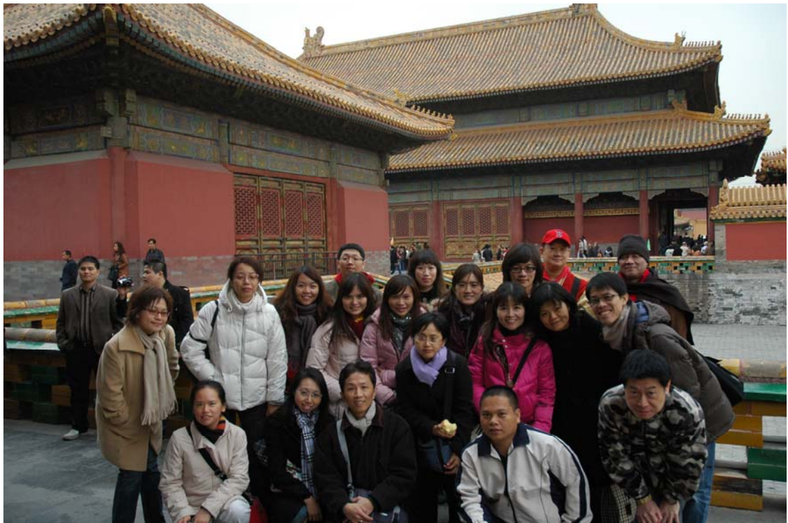
團員合影_北京故宮