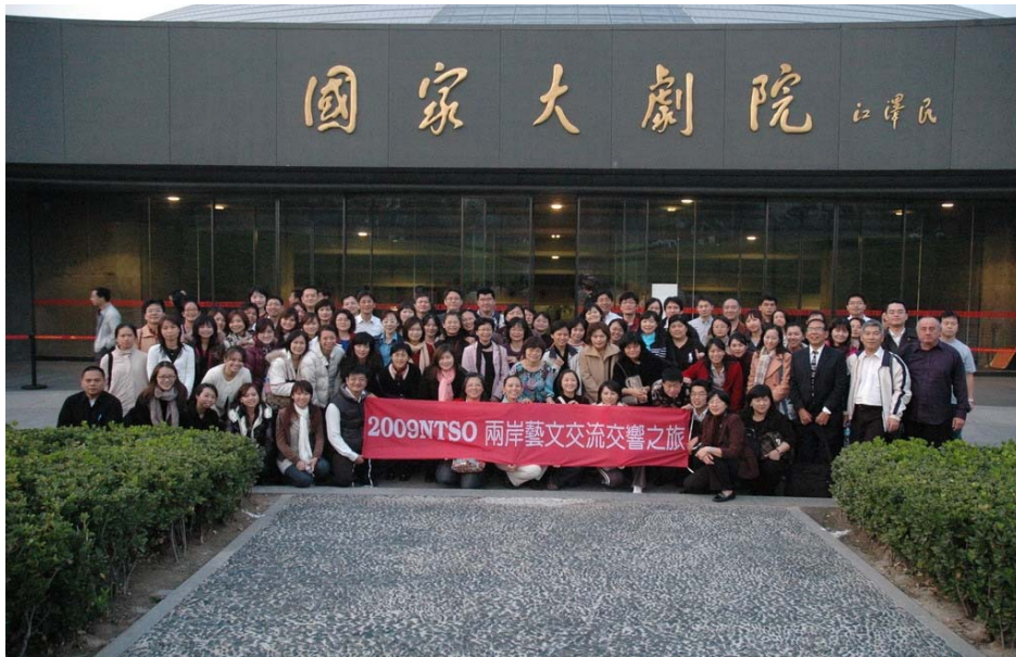
國臺交團員與客席指揮於劇院外合照