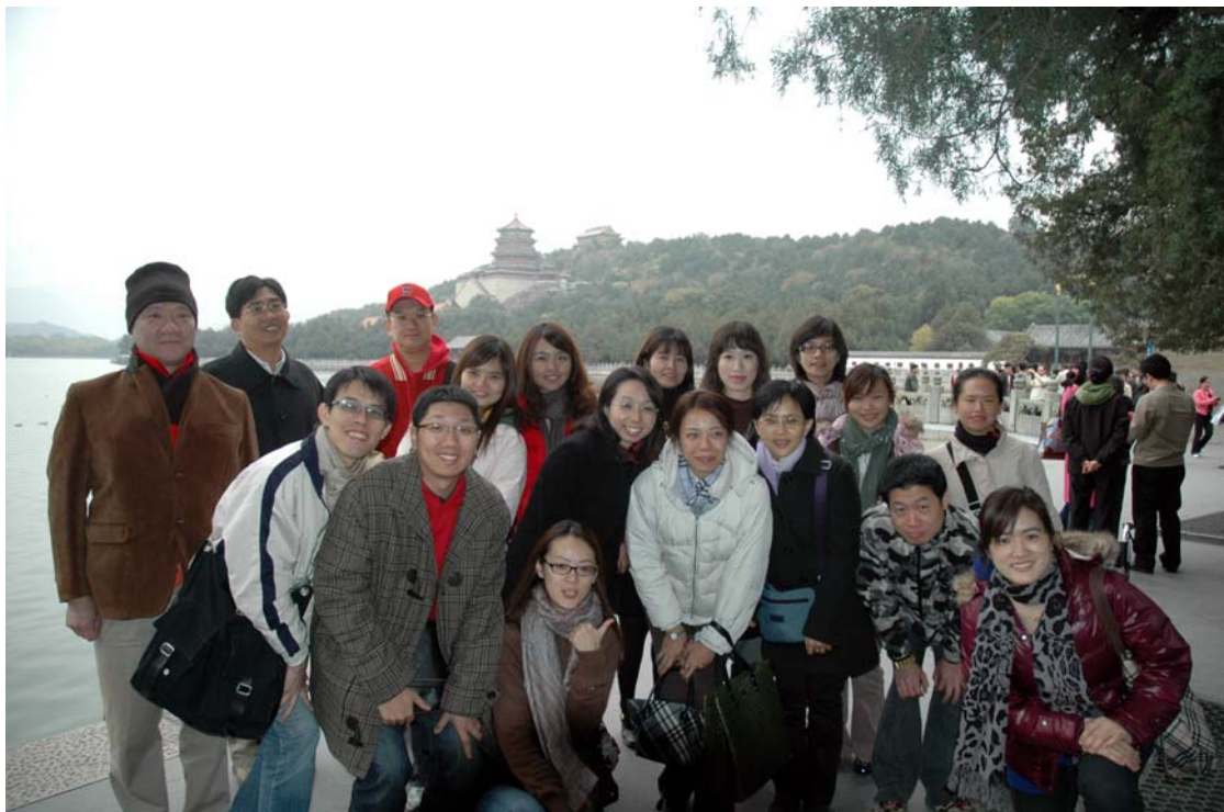
團員合影 2_北京頤和園