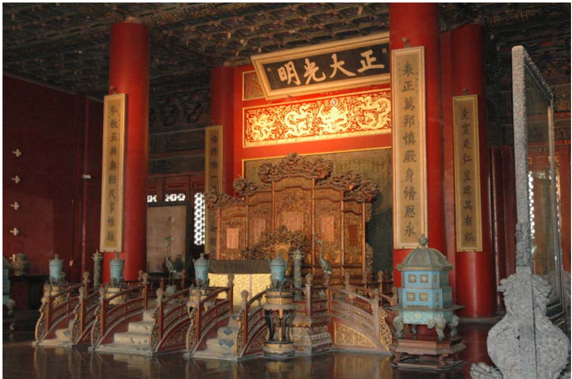
正大光明殿_北京故宮