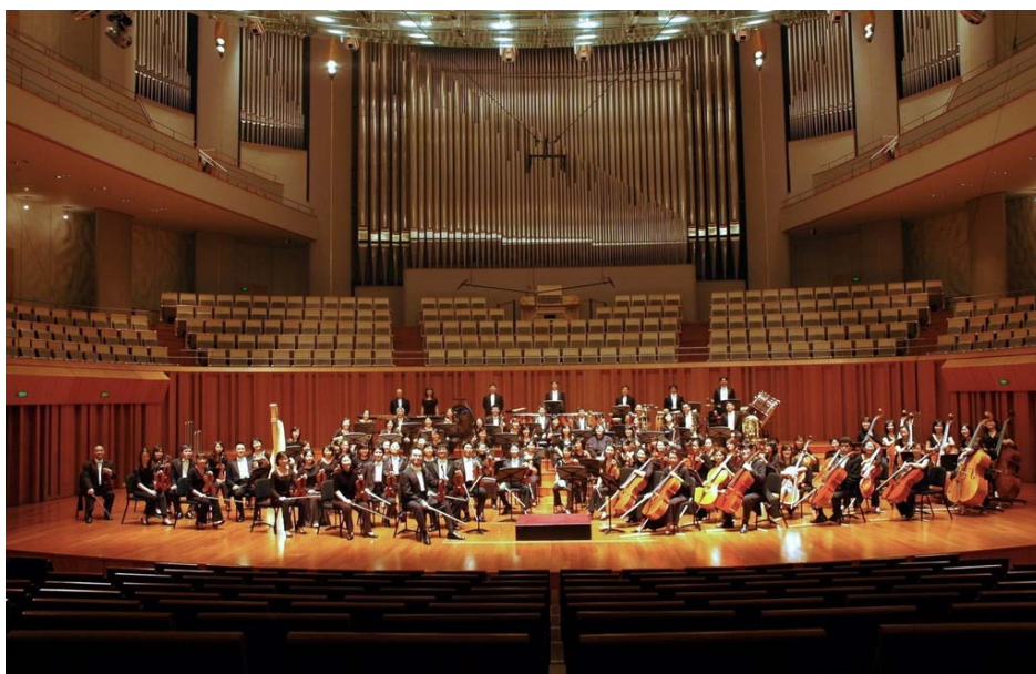
音樂會後樂團於劇院內合照