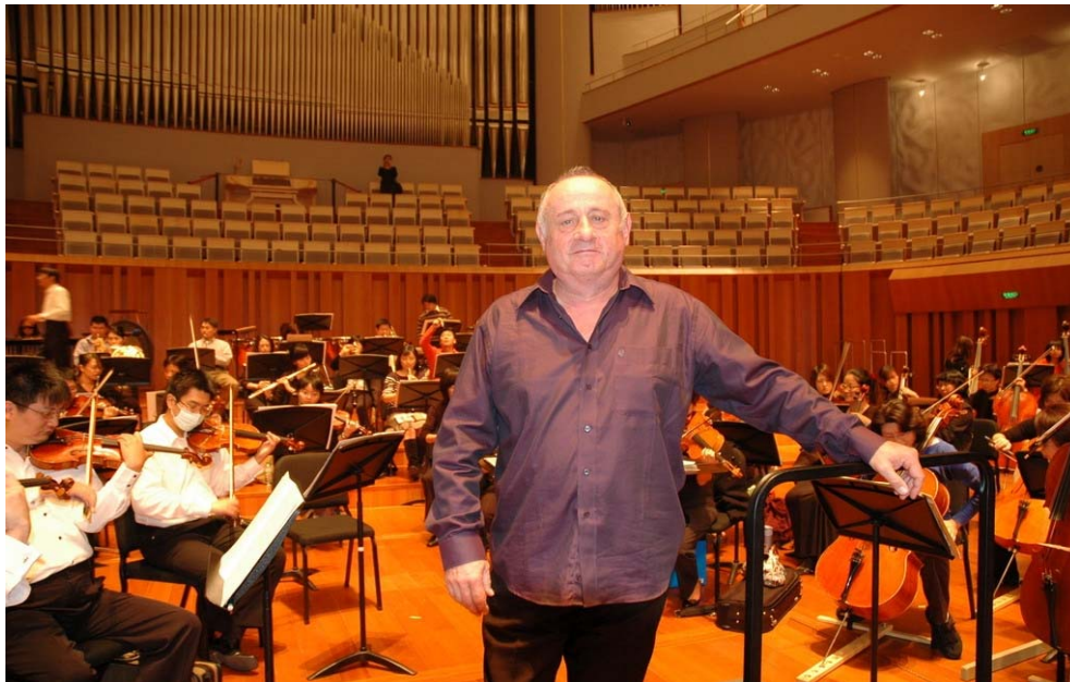
客席指揮/湯瑪斯·蓋爾 Tamas Gal