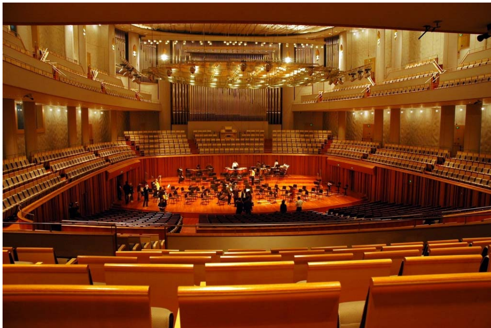
國家大劇院舞台與觀眾席