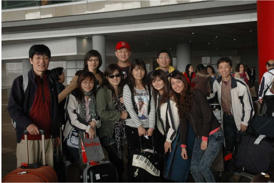
國臺交團員抵達北京