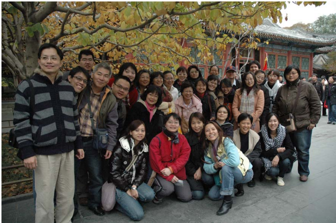
團員合影 1_北京頤和園