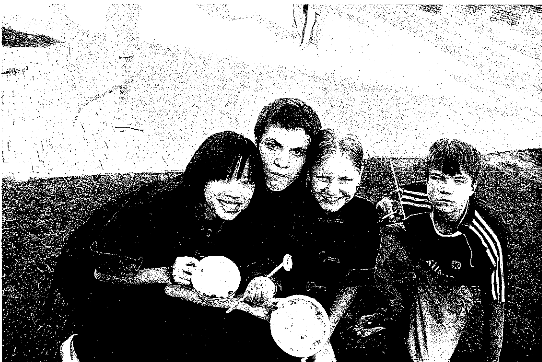
教孩子們使用筷子，他們看起來得心應手！圖/林乃絹提供