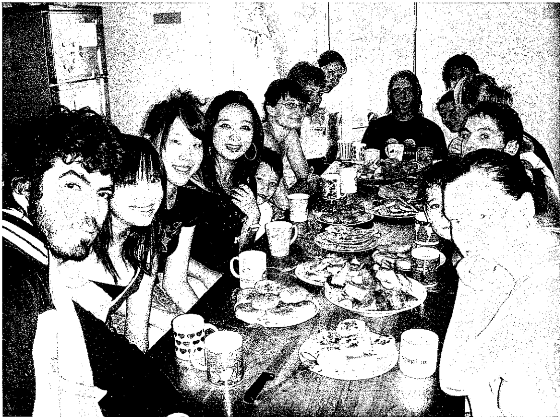
在孩子的房子裡舉辦一場派對，手工製作台灣的传统食物水煎包、蔥油餅。