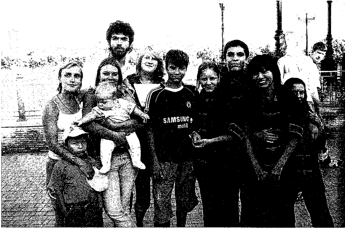
帶孩子至市中心參加其他 NGO 舉辦的活動，孩子們穿起唐裝很有趣。