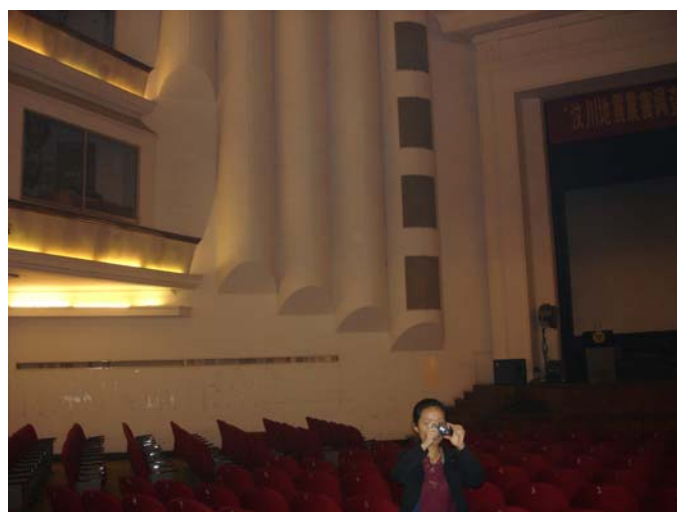
廳堂音響環境改善反射構造設施