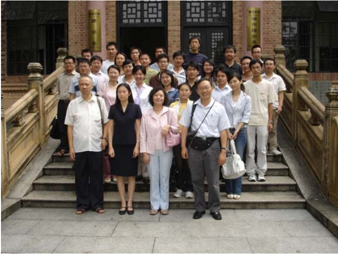
與華南理工建築學院師生合影

工程國家級培養教師 1 人，省級培養教師 1 人，校級培養教師 11 人， 國家、省部級先進教師 5 人，廳局級及校級先進教師 12 人。