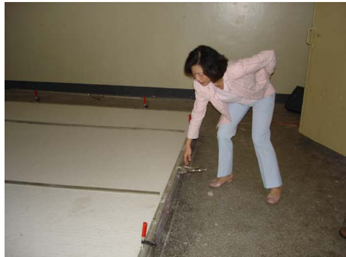
參觀吸音係數量測實驗室