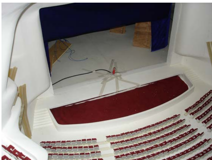
建築廳堂音響物理舞台區模型配置