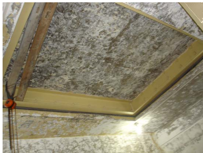
樓板衝擊音實驗室試件置放情形