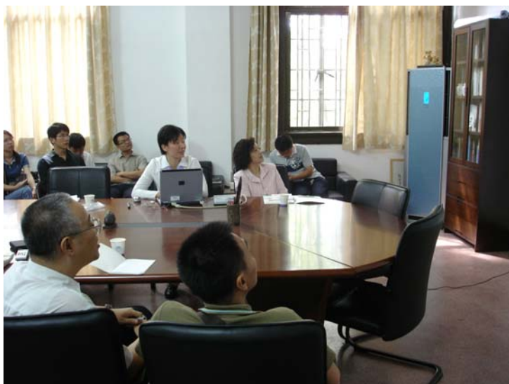
與華南理工亞熱帶建築實驗室師生進行學術交流研討會