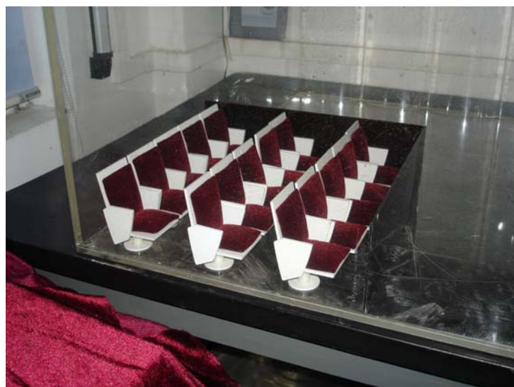
建築廳堂音響物理模型座椅吸音率實驗