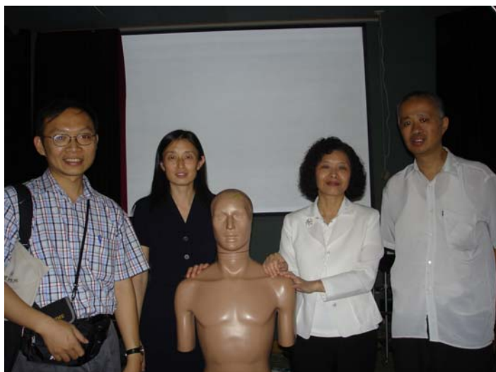
與聲學所謝蘇蓀所長於實驗室合影

為研究對象之限制，經謝蘇蓀所長表示東方人因頭形尺寸皆較西方人嬌小，故聽覺敏感範圍與西方人相較在高頻部份較為敏感，若於聲學之隔音或吸音設計等若能考慮此項因素，則可使成效較佳，謝所長並贈近期研究成果論文 6 篇。