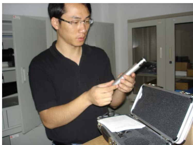
實驗室主任介紹微音器實驗設施