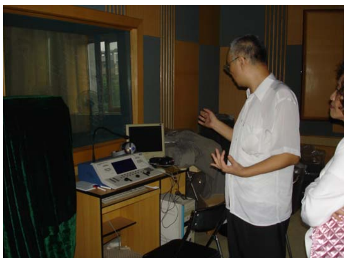
聲學所謝所長介紹實驗室設備