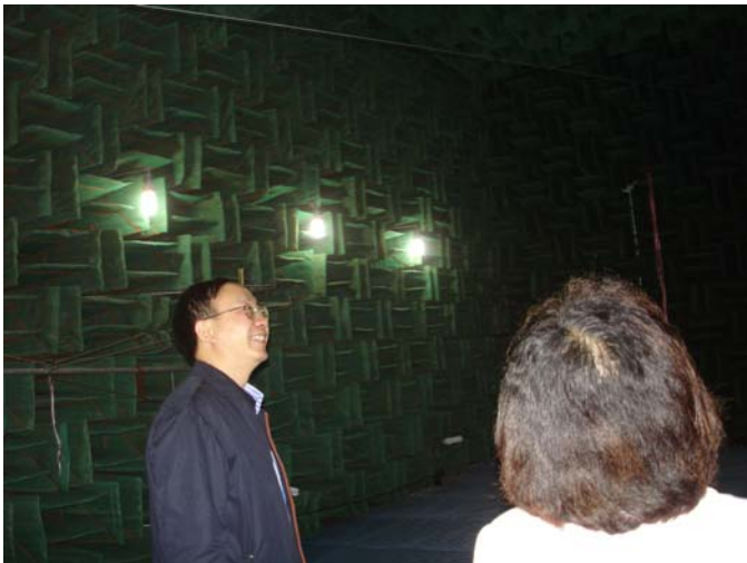
參觀南大聲學所半無響實驗室