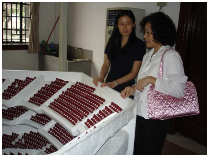
參觀建築廳堂音響物理模型