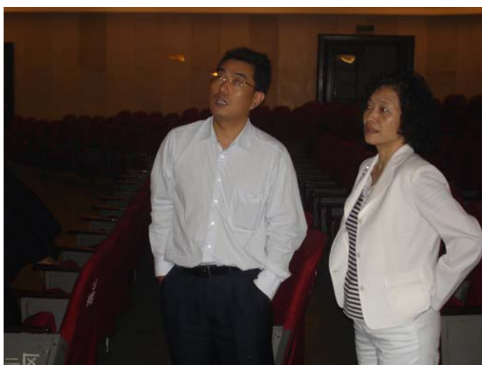
參觀東南大學廳堂音響環境改善實例