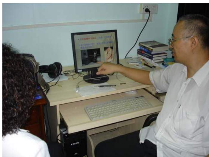
介紹頭部傳輸函數聲學研究成果