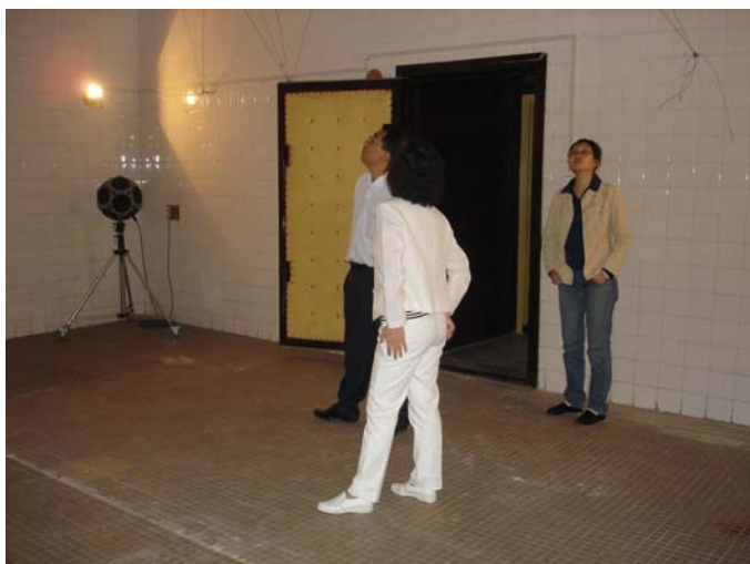
參觀迴響室實驗設備