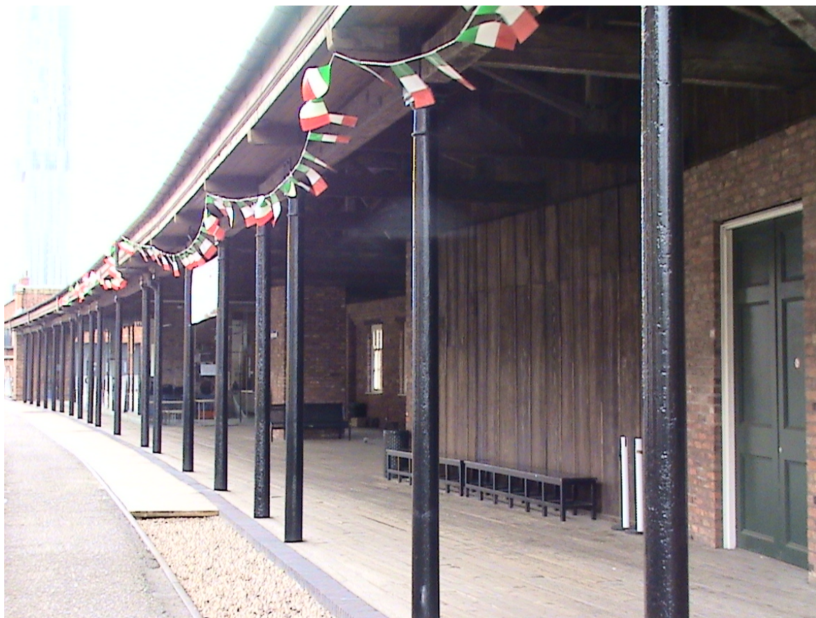
曼徹斯特火車站是世界上最早的一個載客火車站，其月台仍保留並在車站內設立火車站博物館，供人憶往。