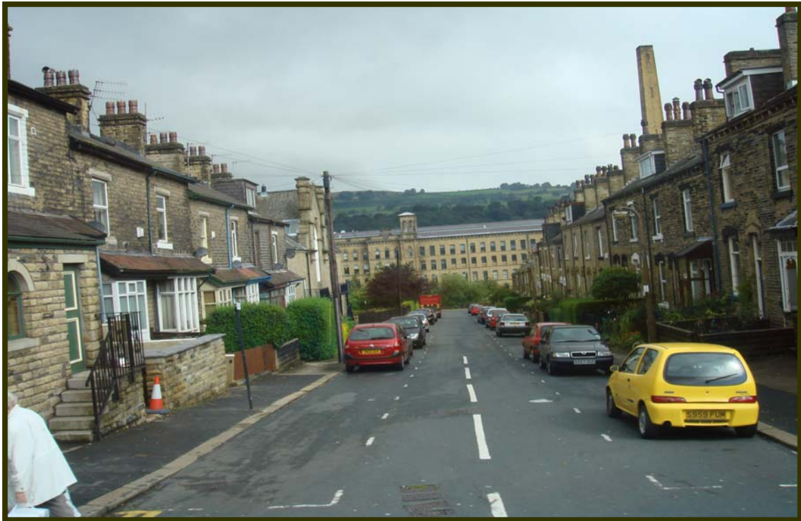
索特爾街景，此建築物原為紡織工廠勞工之住宅，現其外牆仍保留十八世紀以沙岩砌作之牆表，具有歷史文化之價值。