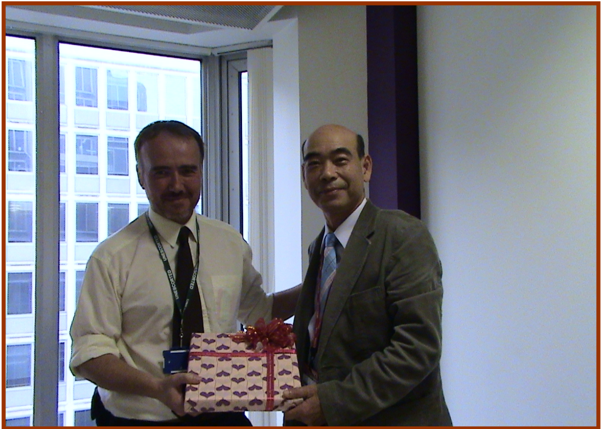
拜會英格蘭自然署並致贈紀念品給英格蘭自然署生態保育專家