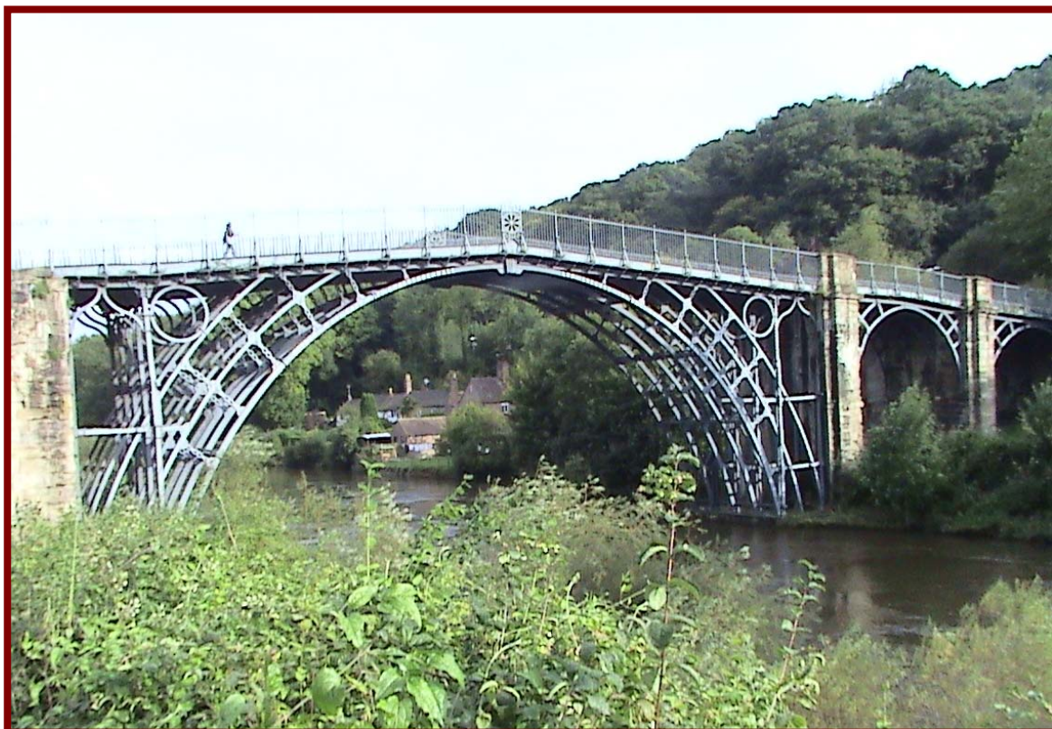
世界上第一座用鐵搭建之橋梁（世界文化遺址）

在鐵橋谷博物群中，此次參觀了較為代表性的五個博物館，各具不同產業的特色，其為峽谷博物館、鐵礦博物館、陶瓷博物館、磁磚博物館、民俗博物館，充分了解英國對於社區之活化工程經營的用心，以及其經營的模式，管理的系統，生態景觀之維護值得吾人參考。