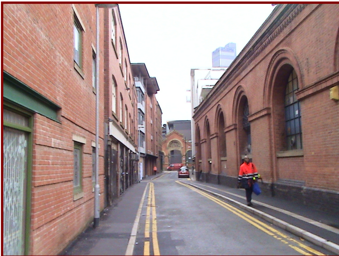
曼徹斯特街景，仍保留十八世紀紡織工業極盛時期之紡織加工廠原貌，但內部作為住宅或商業用途