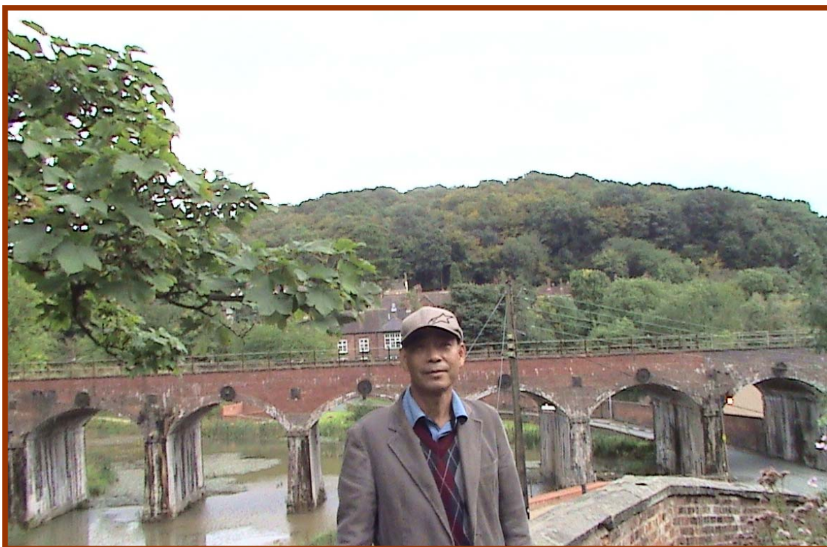
鐵橋谷博物館群中舊有鐵道之橋墩