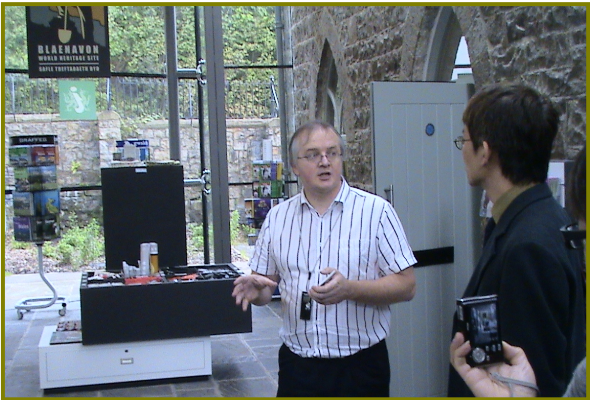
南威爾斯 Blaenavon 郡人員簡報該區煤礦史及社區活化之作法