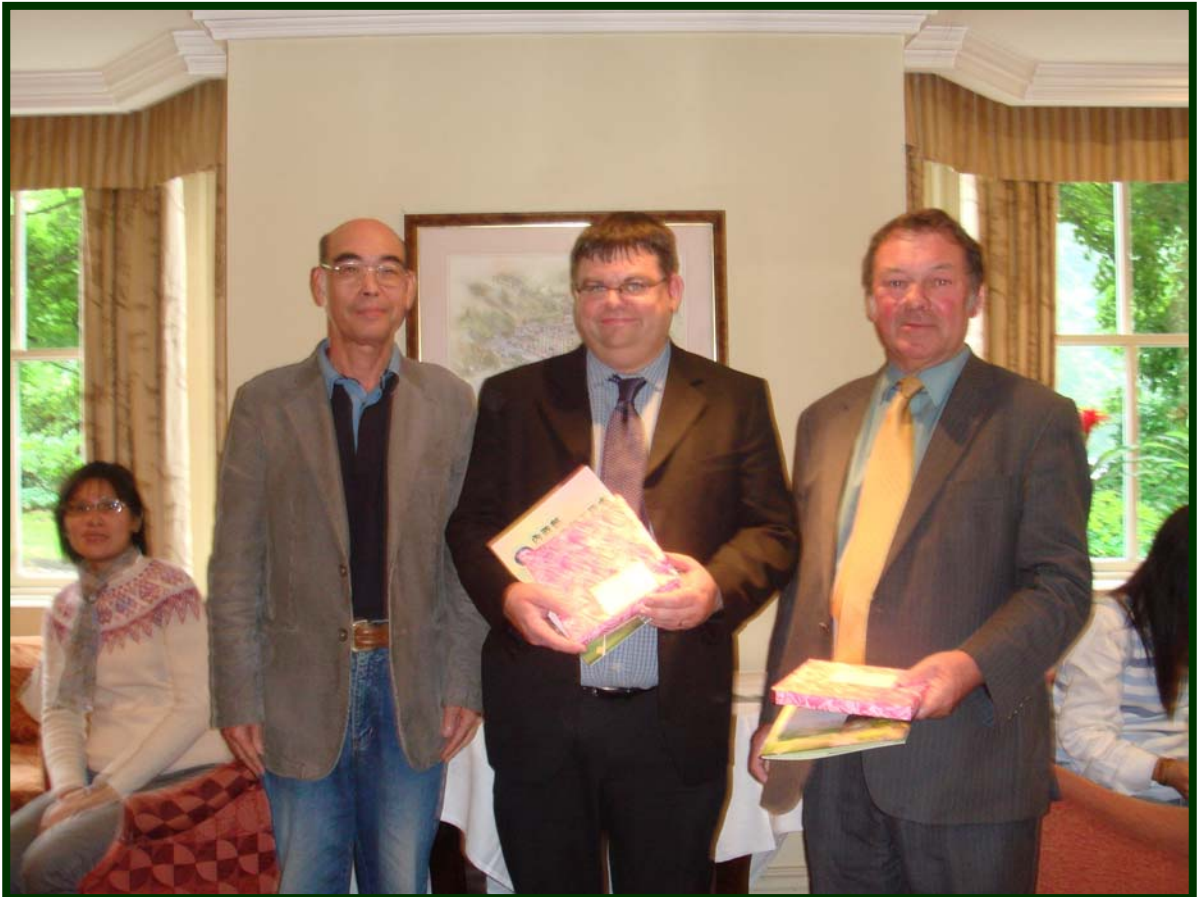
贈送紀念品給德文特河谷產業博物館簡報人員

沿德文特河畔走廊，有許多國家歷史遺跡，2001 年被聯合國列為世界文化遺產，其之所以被聯合國教科文組織列入產業文化之遺產，係經相關單位和文化人士歷時 30 幾年之爭取維護並予組織化後，始予列入。