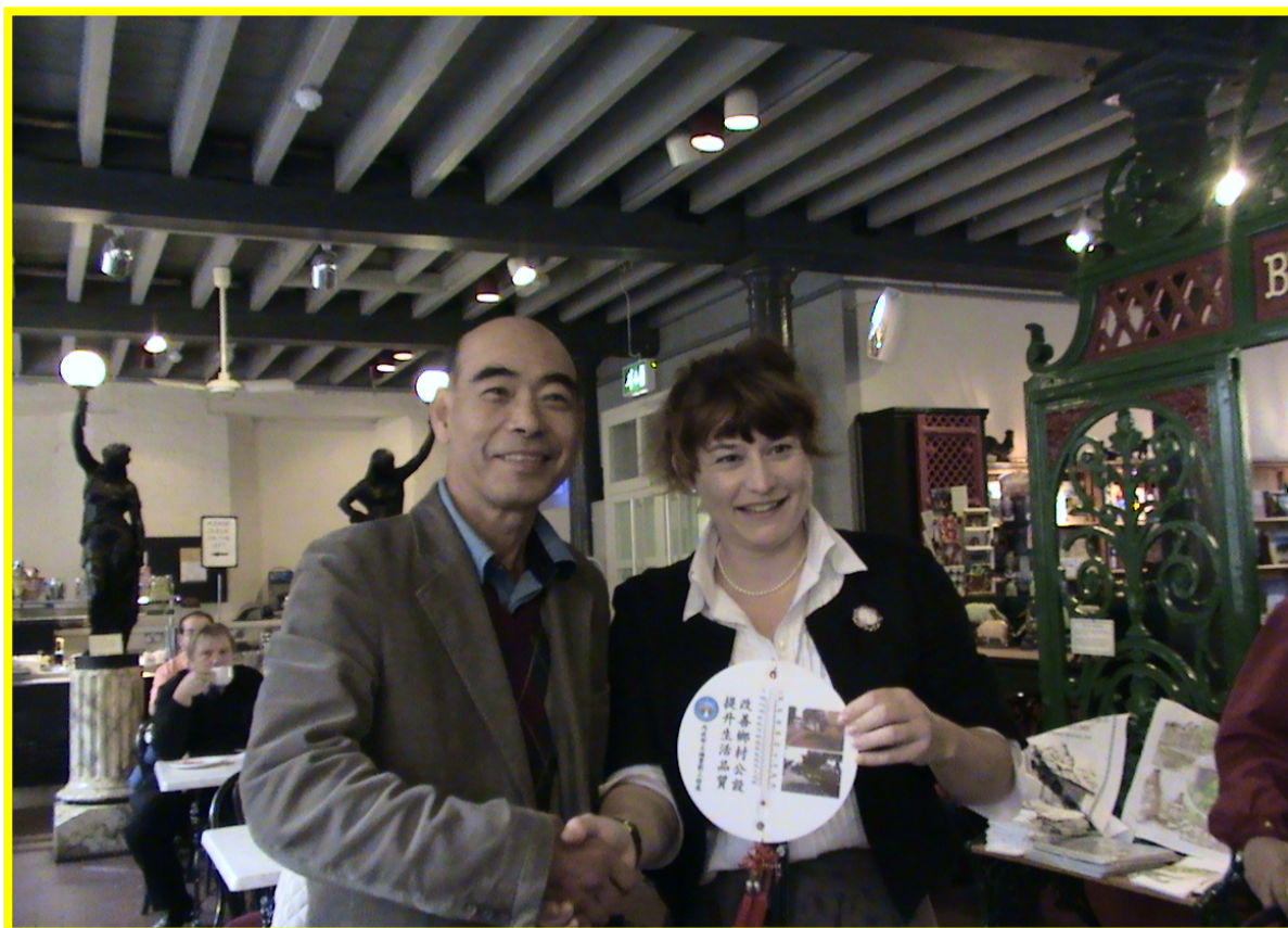
致贈紀念品給伯明罕大學鐵橋谷學院簡報人員