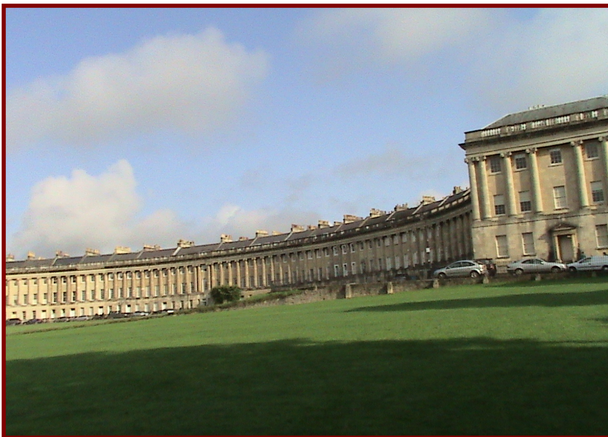
巴斯皇家新月形皇宮，現已作為旅館使用