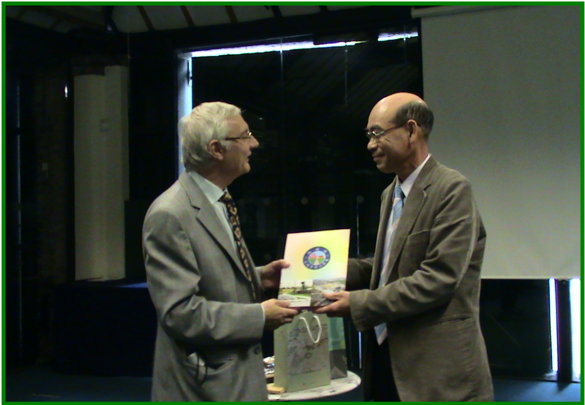
致贈本處簡介及紀念品給鐵橋谷博物館群總監