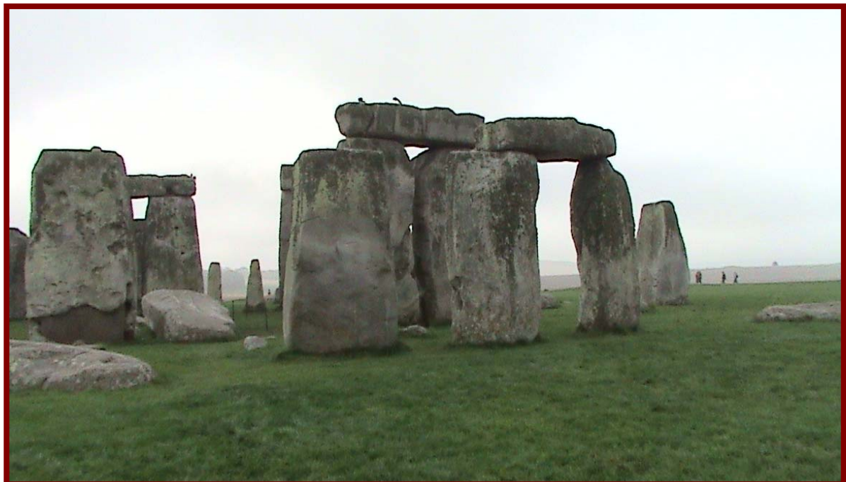
英格蘭巨石群（世界文化遺址）

倫敦－英國首都，是一個能提供生命所能給予的一切的城市，它不僅有歷史性的宏偉建築和優雅的皇室文化，吸引人的藝術及多樣化的時尚文化，豐富的歌舞音樂劇，同時還有豐富的文化遺產，全城約有 300 家美術館及博物館，更見文化氣息之濃郁，由於倫敦是英國文化、政治、經濟和商業的中心城市，人口約八百多萬人，也是個種族文化的大融爐，各色人種聚集，也形成它多樣性的文化，市區交通擁擠，塞車在上下班時尤為嚴重。