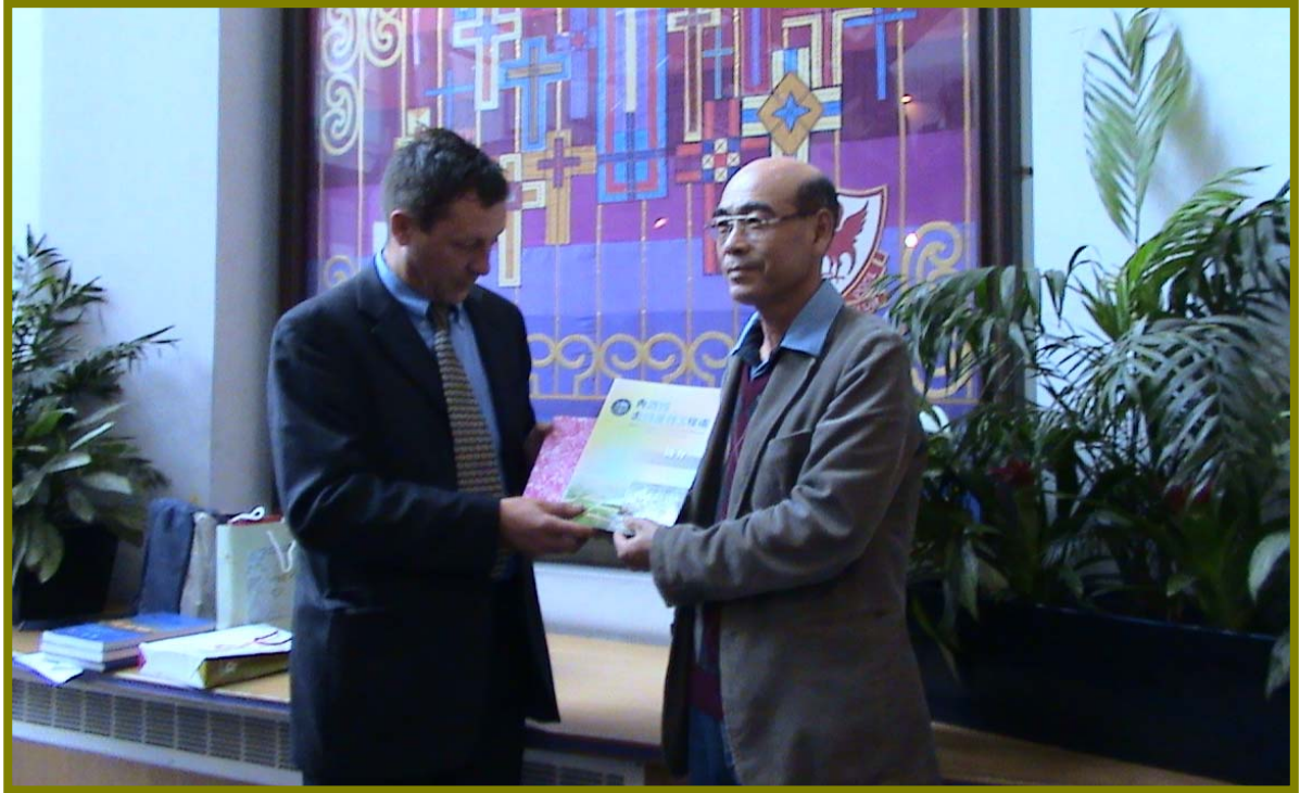
贈送紀念品及本處簡介給利物浦市文化遺址辦公室簡報官員