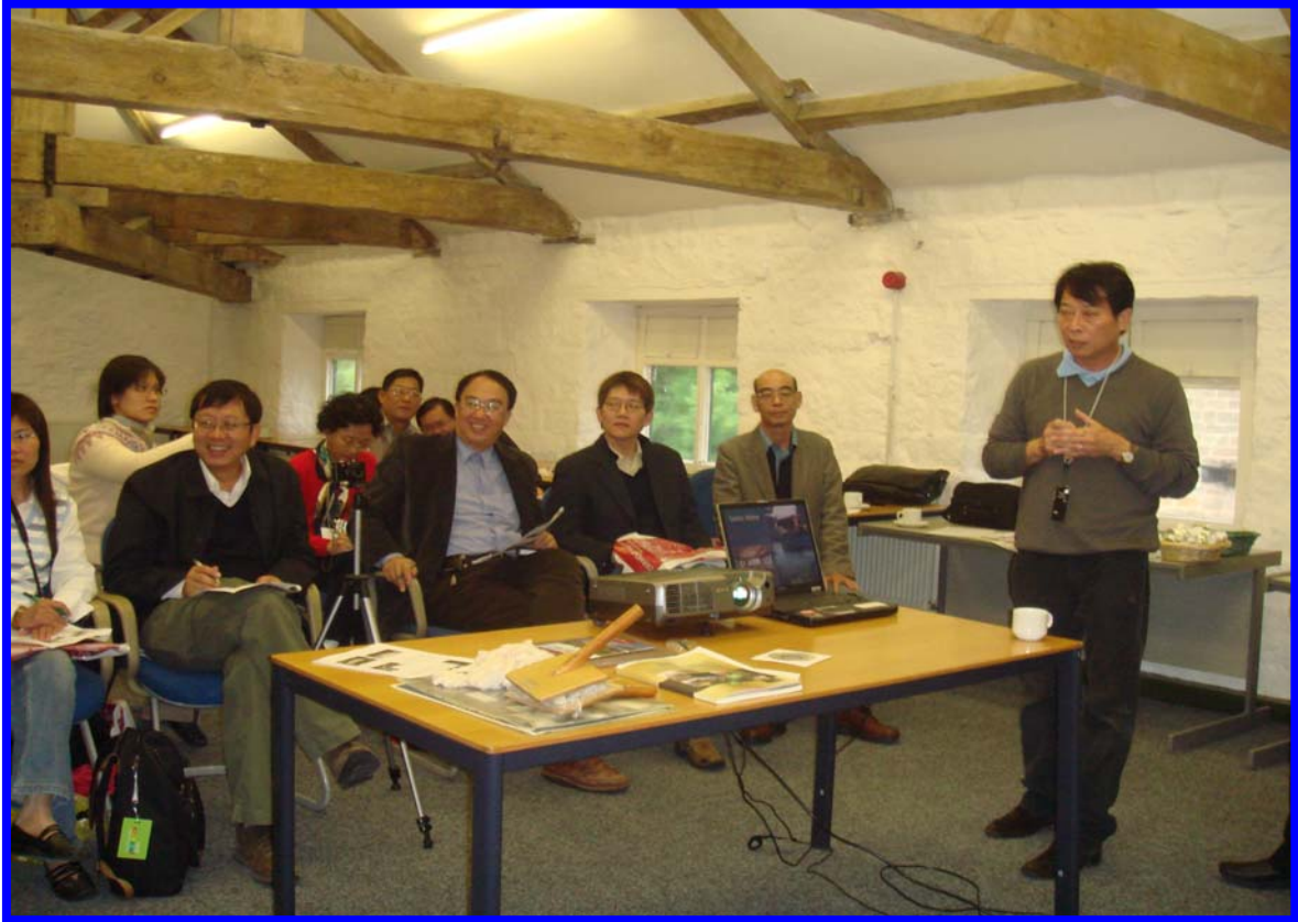
聽取德文特河谷產業博物館人員之簡報