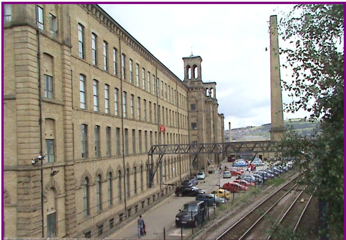
索特爾原十八世紀時之紡織工廠仍保留其外觀，惟內部已整修並作為販售各類物品之商場