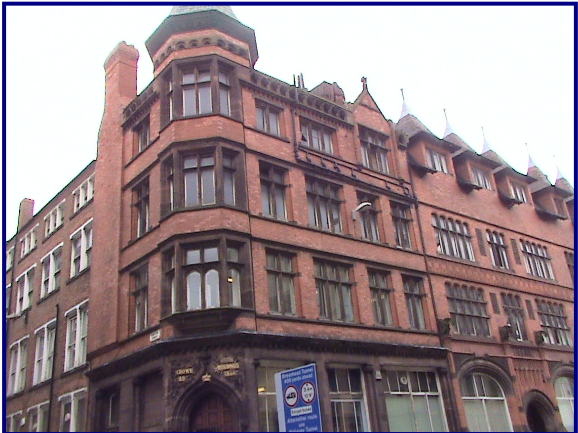
利物浦亞伯特港區之原有貿易大樓現仍保持其原有外觀，內部現作為辦公大樓使用