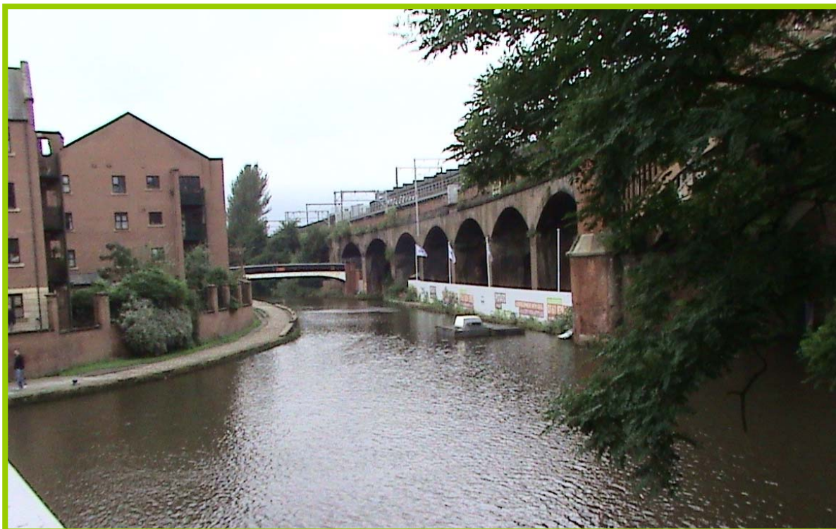
曼徹斯特原運煤等貨物之運河，經綠美化後，與古老之建築物互相輝映，讓人有如回到十八世紀當時的情景。