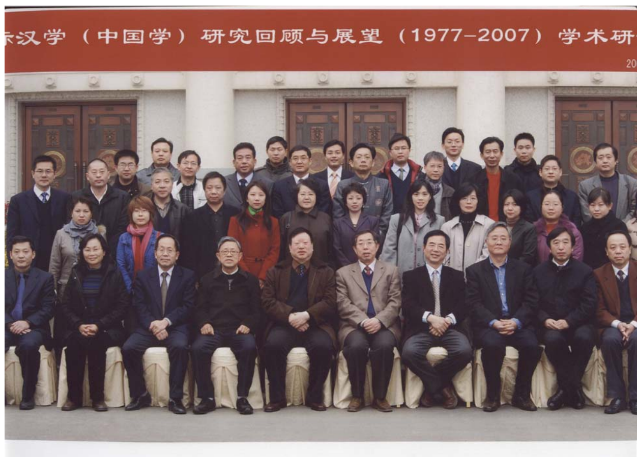
國際漢學(中國學)研究回顧與展望(1977—2007)學術研討會與會學者合影