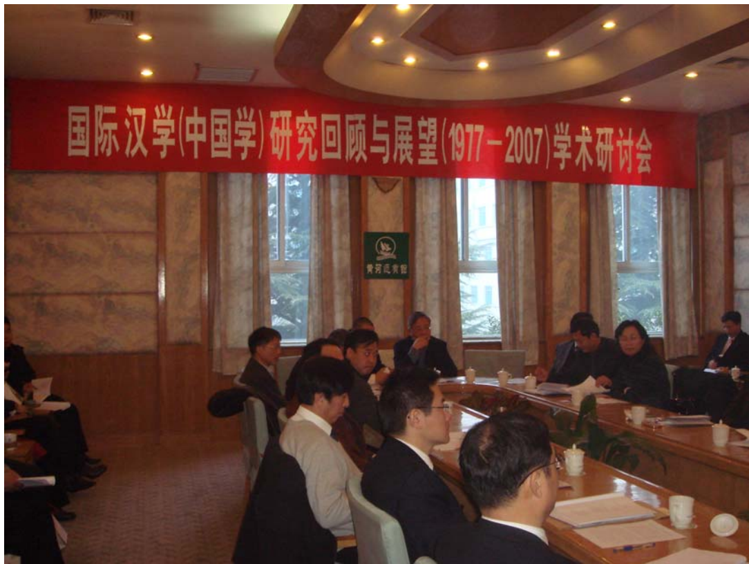
國際漢學(中國學)研究回顧與展望(1977—2007)學術研討會會場一角