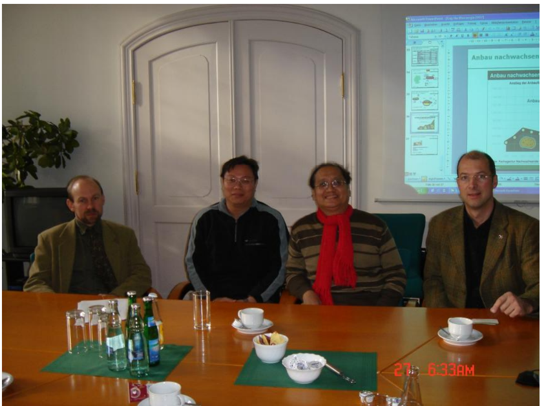
參訪 FACHAGENTURE 環境安全暨能源技術研究所

因考量建造硬體價格較高及建材一體的太陽能光電之收購價，目前以德國住宅來說，投資太陽能光電 5,000 歐元/每仟瓦的硬體成本計算，每年產電 800 度，每度以新台幣 20 元收購，每仟瓦每年約有新台幣 16,000 元之收入。大約在第 12 年可以回收成本，淨利保證收購價格可到 20 年；除此之外，也有直接補助和低利貸款。另外，配合「10 萬戶屋訂計畫」四年計畫，從 1999 年到 2003 年已完成目標，總共 300 萬瓦的電力。