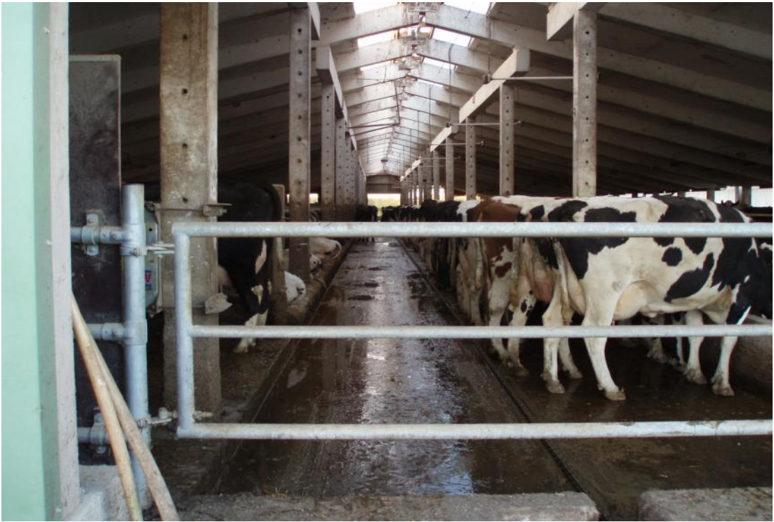
牛舍外觀、中間凹陷部分為刮糞板軌道