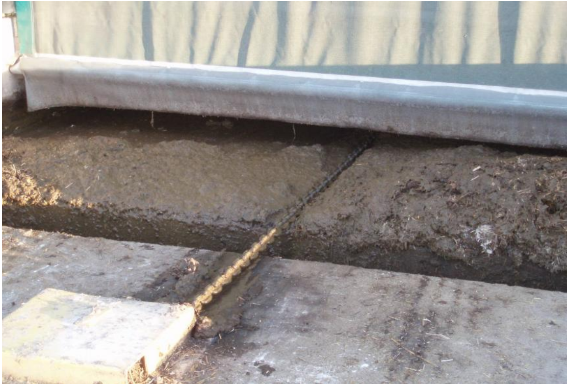
牛糞刮出牛舍後之狀況