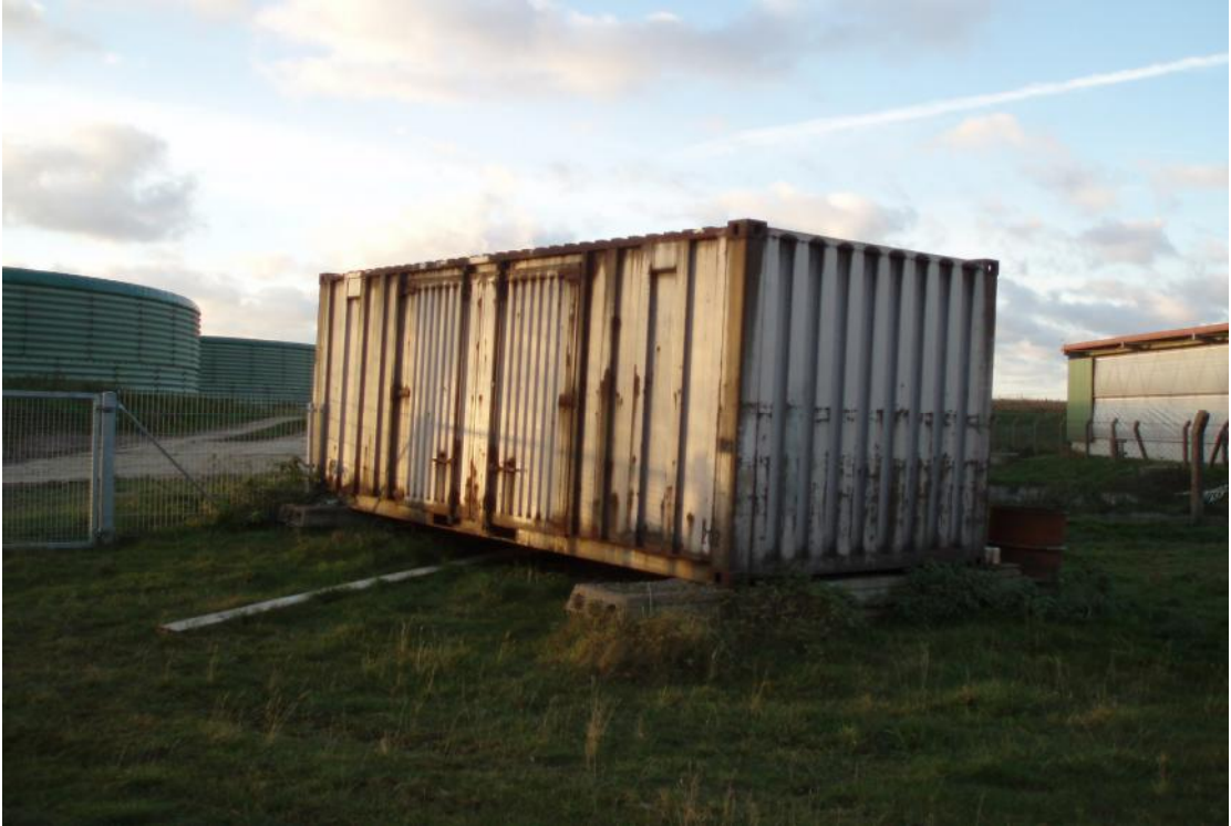
斃死豬、牛暫存設施