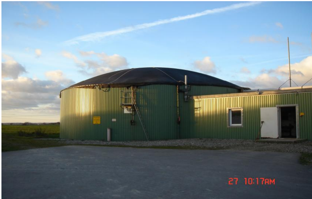
沼氣發電設備機械室