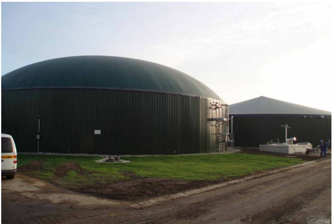
雞、牛糞尿及農業廢棄物儲存槽