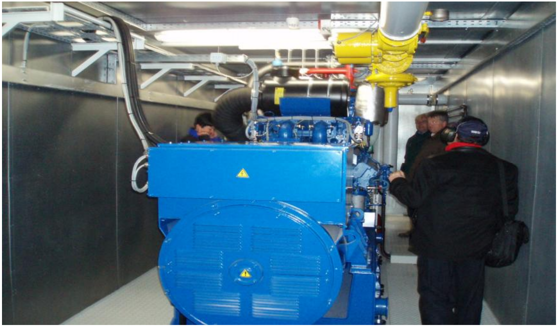
沼氣發電機、功率 500 仟瓦