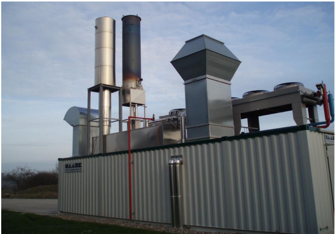
沼氣發電設備機械室