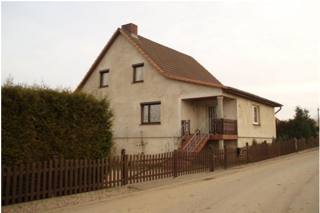
休閒農場內經整修後的民宿