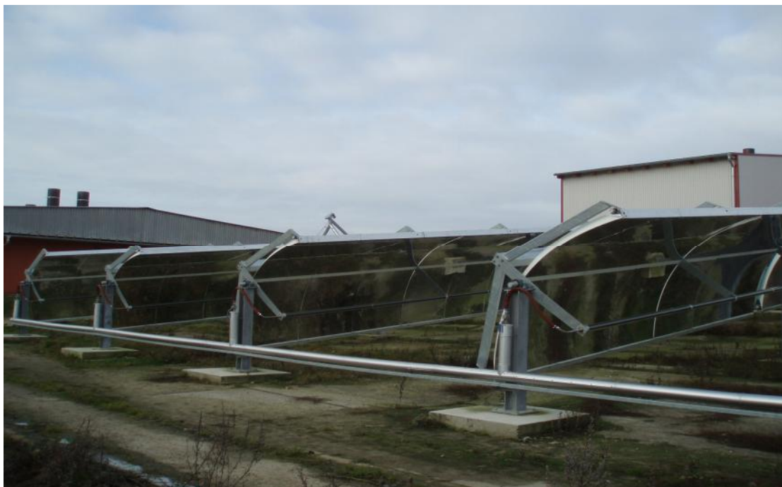
小型碟式太陽能集收器設備