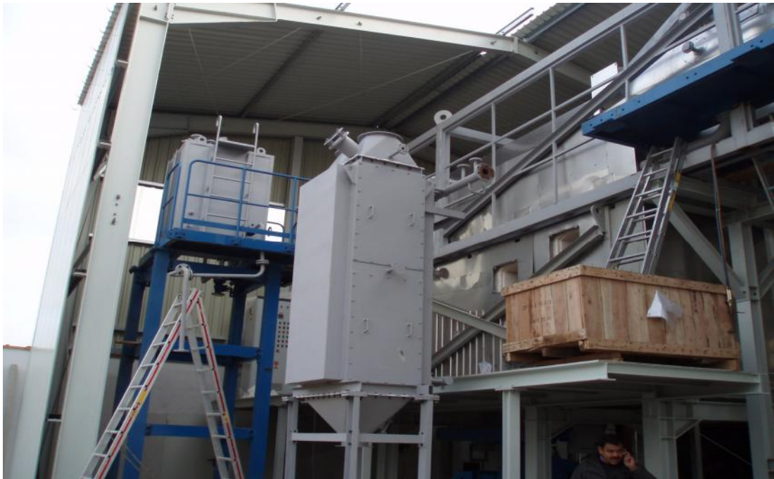
燃燒農村廢棄物的生質能源設施