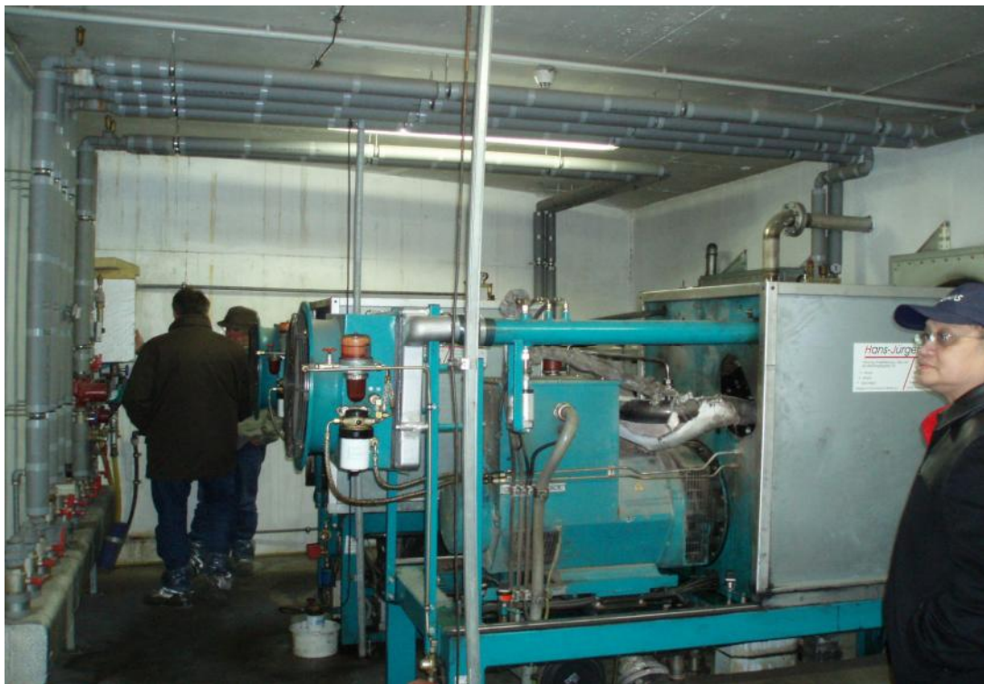
2 臺沼氣發電機、每臺功率 65 仟瓦